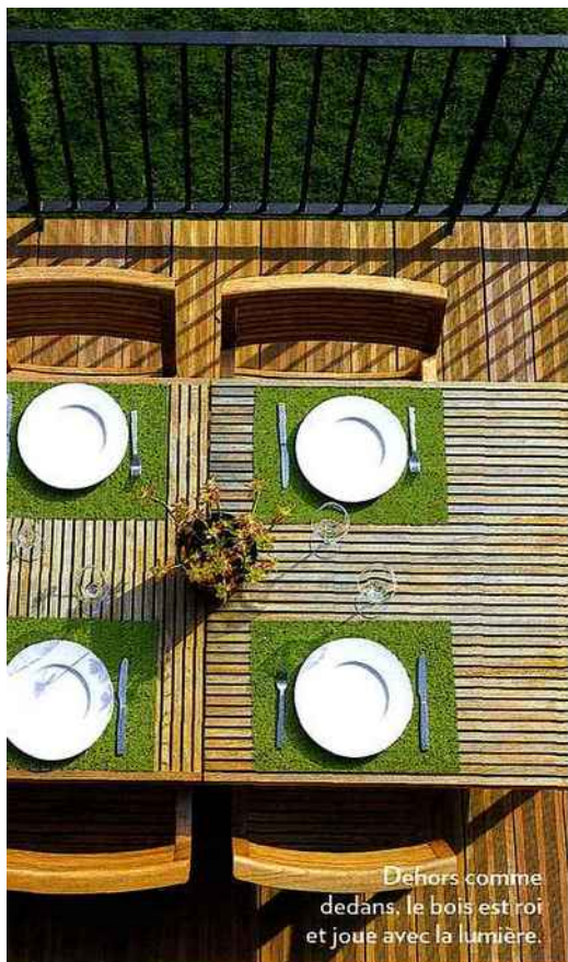
Dehors comme dedans, le bois est roi et joue avec la lumière.