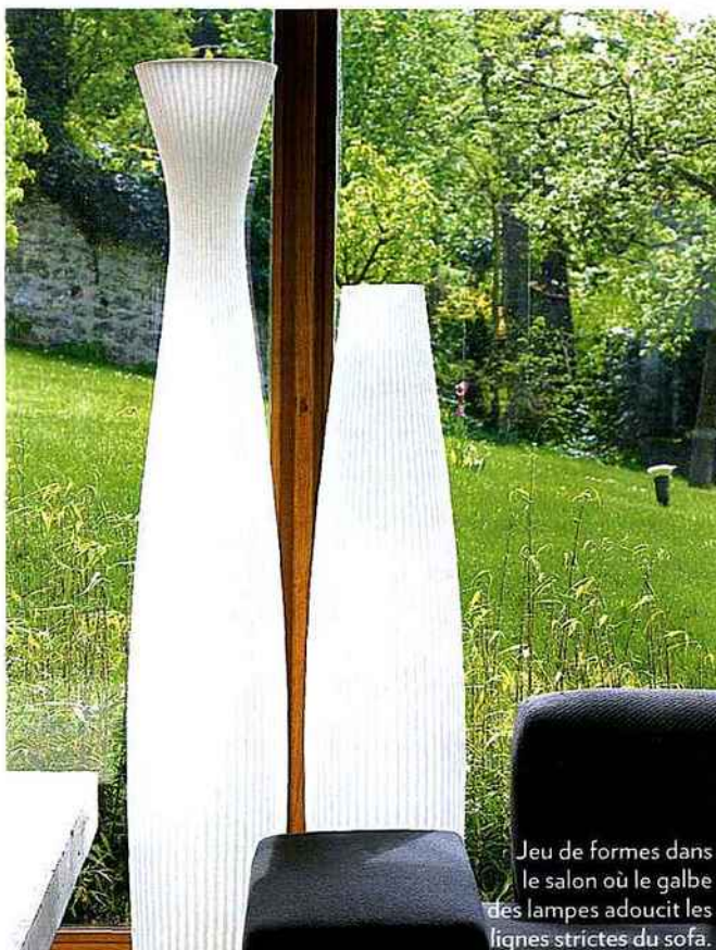
Jeu de formes dans le salon où le galbe des lampes adoucit les lignes strictes du sofa.

(*) Une réalisation des architectes Barbier et Barton.