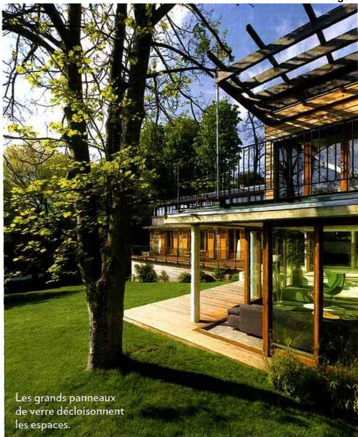
Les grands panneaux de verre décloisonnent les espaces.