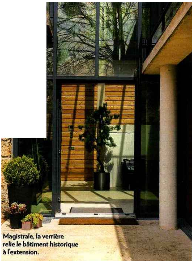
Magistrale, la verrière relie le bâtiment historique à l'extension.