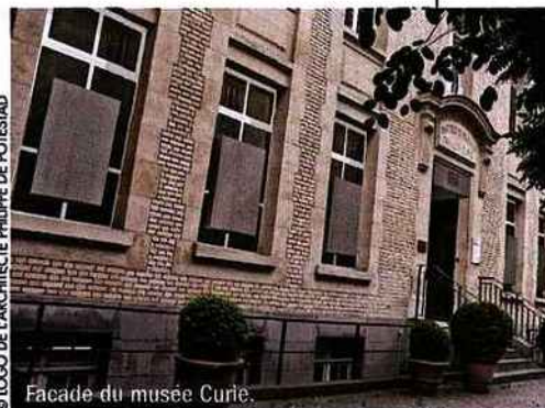
© LOGO DE L'ARCHITECTE PHILIPPE DE POTESTAD

Musée Curie, 1, rue Pierre-et-Marie Curie, 5 e . Ouvert du mercredi au vendredi. De 13 h à 17 h. Tél. 01 56 24 55 33. Entrée libre.