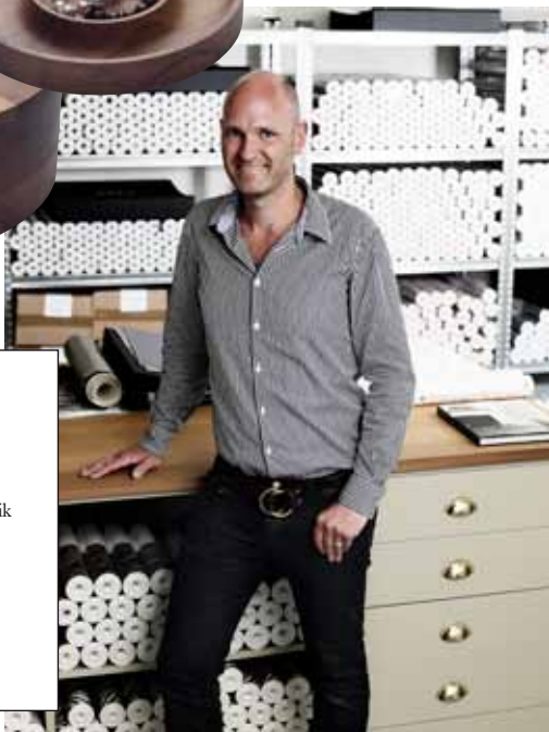
Tekst Jannik Martensen-Larsen

ELLEs design-klummeskribent gik ind i familiefirmaet Tapet Café i 1999 og fungerer i dag som interiørspecialist – bl.a. kendt fra tv-programmerne Feinschmecker og BoligBattle. Se mere på Tapet-cafe.dk.